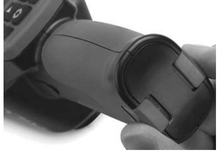
Рис. 3 - Крышка батарейного отсека