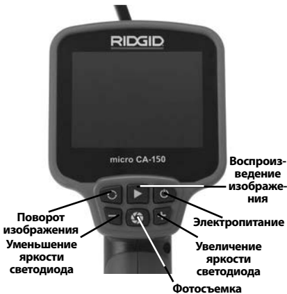
Рис. 8 - Средства управления