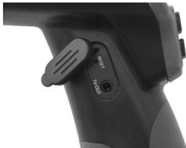
Рис. 9 - Гнездо выхода телевизионного сигнала TV-OUT/Кнопка сброса "Reset"

Вставьте другой конец кабеля в гнездо видеовхода телевизора или видеомонитора. Возможно, для просмотра изображения на телевизоре или видеомониторе придется включить соответствующий вход видеосигнала.