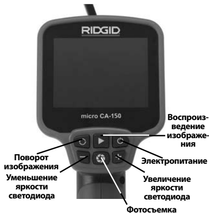
Рис. 8 - Средства управления