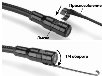
Рис. 6 - Установка принадлежностей

Чтобы прикрепить приспособление, необходимо удерживать головку формирования изображения так, как показано на рис. 6. Вставьте полукруглый конец приспособления на лыски головки формирования изображения, как показано на рис. 6. Затем поверните приспособление на 1/4 оборота так, чтобы его длинная ручка выдвигалась наружу, как показано на рис. 6.