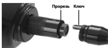
Рис. 5 - Кабельные соединения

Чтобы использовать инспекционную видеокамеру micro CA-150, необходимо присоединить кабель с головкой формирования изображения к переносному блоку дисплея. Перед подсоединением кабеля к переносному блоку дисплея, удостоверьтесь, что ключ и прорезь (рис. 5) совмещены надлежащим образом. После этого от руки затяните цилиндрическую ручку с накаткой, чтобы зафиксировать соединение.