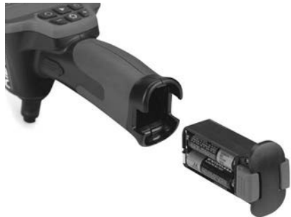
Рис. 4 - Батарейный отсек