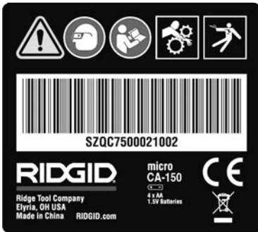
Рис. 7 - Предупредительная этикетка