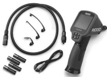
Рис. 1 - Инспекционная видеокамера micro CA-150